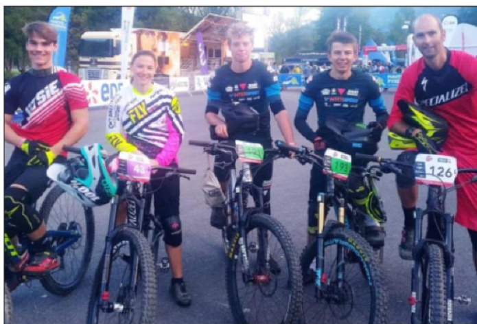
Outre le plaisir de rouler et de l'engagement, les pilotes du Véloroc Guil Durance se sont offert de belles places au classement, ce week-end dans les Pyrénées.

Ils ne sont pour autant pas motivés pour rentrer les vélos. Zian sera d'ailleurs à Ainsa (Espagne) pour une manche de World series, le week-end prochain.