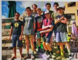
Le groupe YDH du PJPC a obtenu de bons résultats à Isola 2000.

À Isola 2000, quelques descendeurs du groupe YDH du club PJPC ont participé à une course régionale. La piste, très variée et poussiéreuse, a demandé de grosses capacités physiques de la part des jeunes vététistes. Elle était aussi parfaite pour préparer au mieux l'objectif de la saison, la finale de la coupe de France de DH qui aura lieu ce week-end