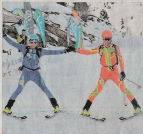
À l'arrivée de l'Altitoï dans les Hautes-Pyrénées.

Pour préparer son avenir, mardi 20 mars à Montgenève, il a passé les tests techniques pour le monitorat de ski alpin et il retrouvera son lycée d'Altitude de Briançon où il est en première pour préparer un bac technique. Après, « ce sera le ski pour le plaisir ». L'été, il le passera dans le hameau de Bramousse où ses parents tiennent un gîte, le lieu idéal pour maintenir sa forme avec du trail, du VTT et de la randonnée.