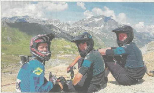
Les trois pilotes en débriefing entre deux spéciales.

À noter que cet événement de VTT Enduro était également une épreuve de qualification pour les Enduro world series.